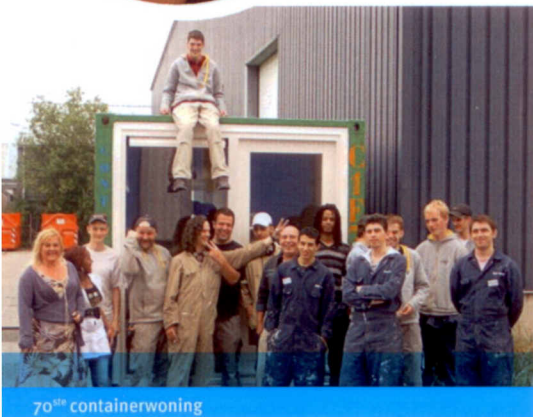
70 ste containerwoning