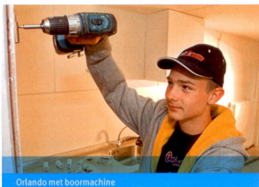
Orlando met boormachine