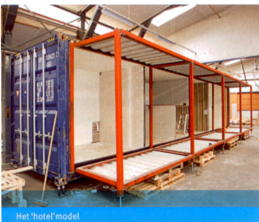
Het 'hotel' model