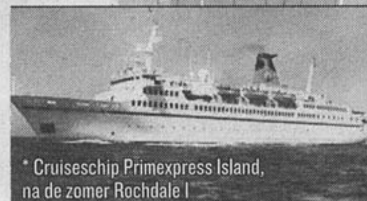
* Cruiseschip Primexpress Island, na de zomer Rochdale I