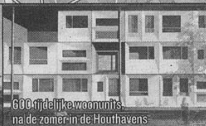
600 tijdelijke woonunits, na de zomer in de Houthavens